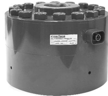
Darstellung mit optionalem Sockel